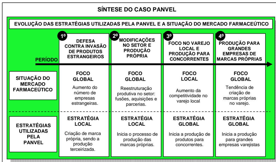
FIGURA 02: Síntese do Caso Panvel